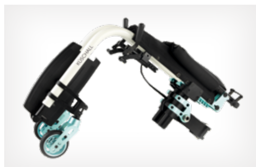
Très compact pour le transport