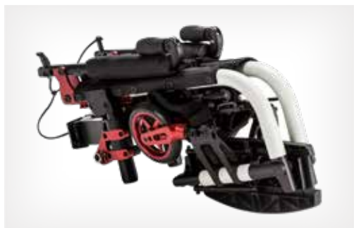
Fauteuil le plus compact pour le transport (grâce à l'option Champion SK)