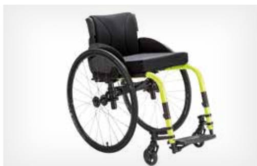
Le fauteuil rigide pliant