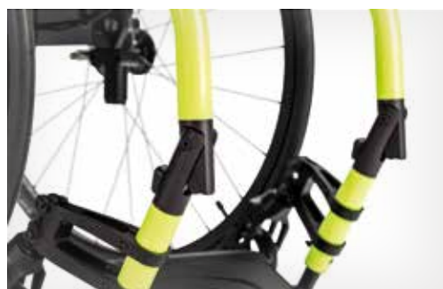
Option Champion SK : châssis avant rabattable (+480 g)