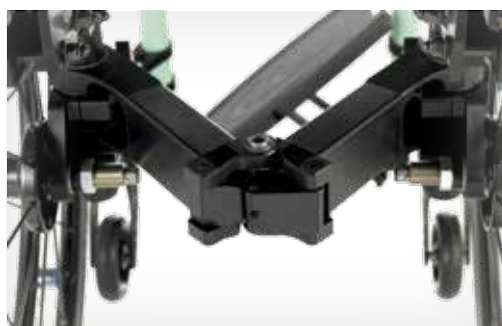
Mécanisme de pliage horizontal unique