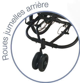
Roues jumelles arrière

Mono repose-jambes articulé assisté par vérin réglable en angle